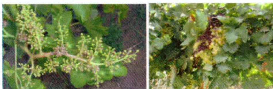
Symptômes du mildiou sur le raisin

Les six chapitres de la troisième partie sont consacrés aux questions phytosanitaires et aux accidents physiologiques de la vigne. Il a été primordial de porter une attention particulière à la connaissance des principaux ennemis de la culture et des moyens de lutte pour les combattre. Cette partie compte beaucoup pour les viticulteurs car toutes les maladies cryptogamiques, virales, de bois, les parasites et les accidents physiologiques constituent de vraies menaces pour la récolte des raisins et pour la pérennité de la culture elle-même.