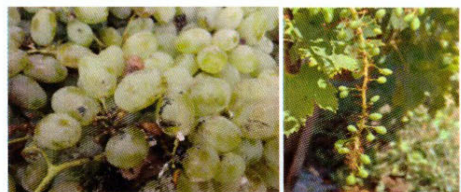
Cas des parasites animaux de la vigne (Cochenille)