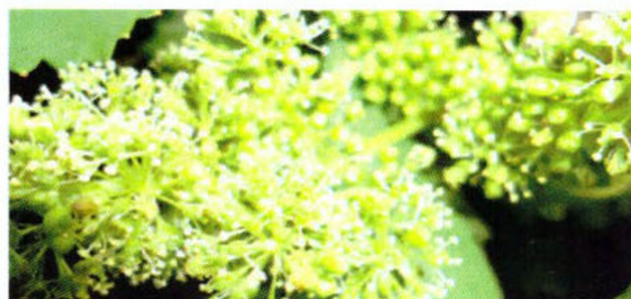
Floraison d'une grappe de la vigne

La culture de la vigne est devenue aujourd'hui trop technique et scientifique. Les viticulteurs ne peuvent plus se contenter des règles ancestrales pour conduire de manière rentable leur vignoble. Ainsi, ce premier outil de sensibilisation et de vulgarisation, riche en informations et en données indispensables, est né pour harmoniser les interventions des différents acteurs et praticiens et contribuer aux renforcements des capacités pour la mise à niveau de la filière de raisin de table.