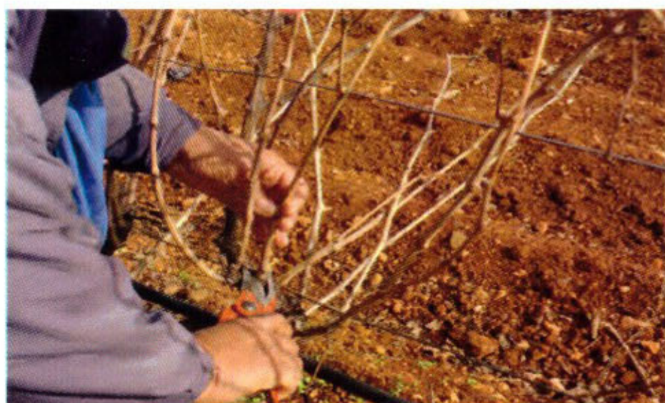
Pratique de la taille

Une deuxième partie, considérée comme le fondement de ce guide, passe en revue les principales questions pratiques pour réussir une nouvelle plantation viticole et une description détaillée de la taille de formation, qui semble être, particulièrement, très importante pour la profession viticole, et dont les viticulteurs trouvent des difficultés à conduire correctement à la fois la formation des jeunes plants de la vigne et l'opération de la taille de fructification.