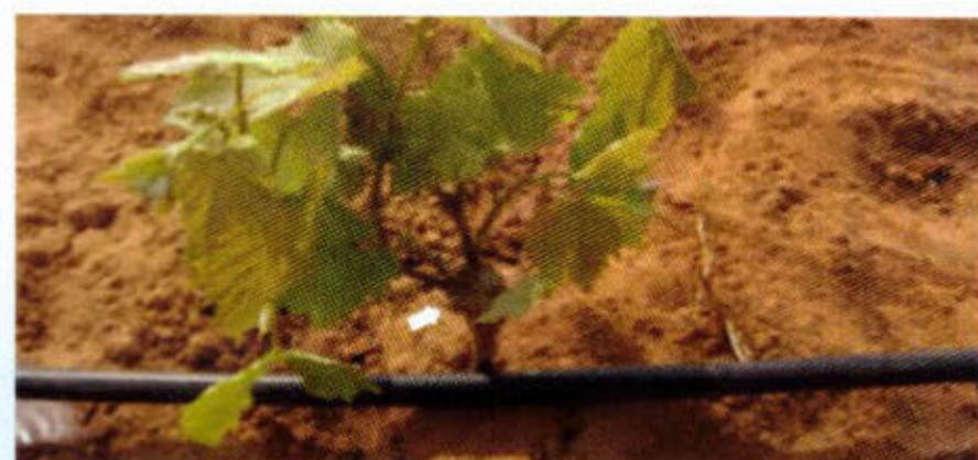
Positionnement du point de greffe par rapport au sol

Une première partie qui présente les notions de base pour permettre à celles et ceux qui pratiquent l'un des métiers de la viticulture de se familiariser avec la vigne cultivée et ces principaux stades phénologiques pour mieux raisonner les différentes opérations.